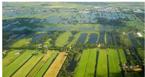
Nieuwkoopse Plassen ter hoogte van Noorden

Er zijn twee zeer uitgestrekte en vrij ondiepe veenplassen: de Noordeinderplas en de Zuideinderplas. Van het lintdorp De Meije bij watertoren Het Potlood naar Nieuwkoop loopt een fietspad: het Meijepad, dwars door de Zuideinderplas. In het midden is een houten brug (kwakel) om scheepvaart van het ene deel naar het andere deel van de plas mogelijk te maken. De grote plassen worden druk bevaren door pleziervaartuigen. De slootjes en kleinere plassen lenen zich uitstekend voor een tocht met roeiboot of kano. Aan het zuidende liggen verschillende jachthavens en botenverhuurders.