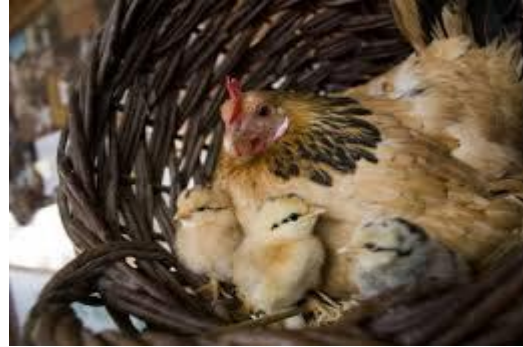
Terugkeer naar Het Kippenhok?

en nu maar hopen dat het "de kleintjes" ruim geïnterpreteerd word en wij mogen helpen met rapen. Twee eitjes delen met z'n vijftwintigen wordt vechten ben ik bang