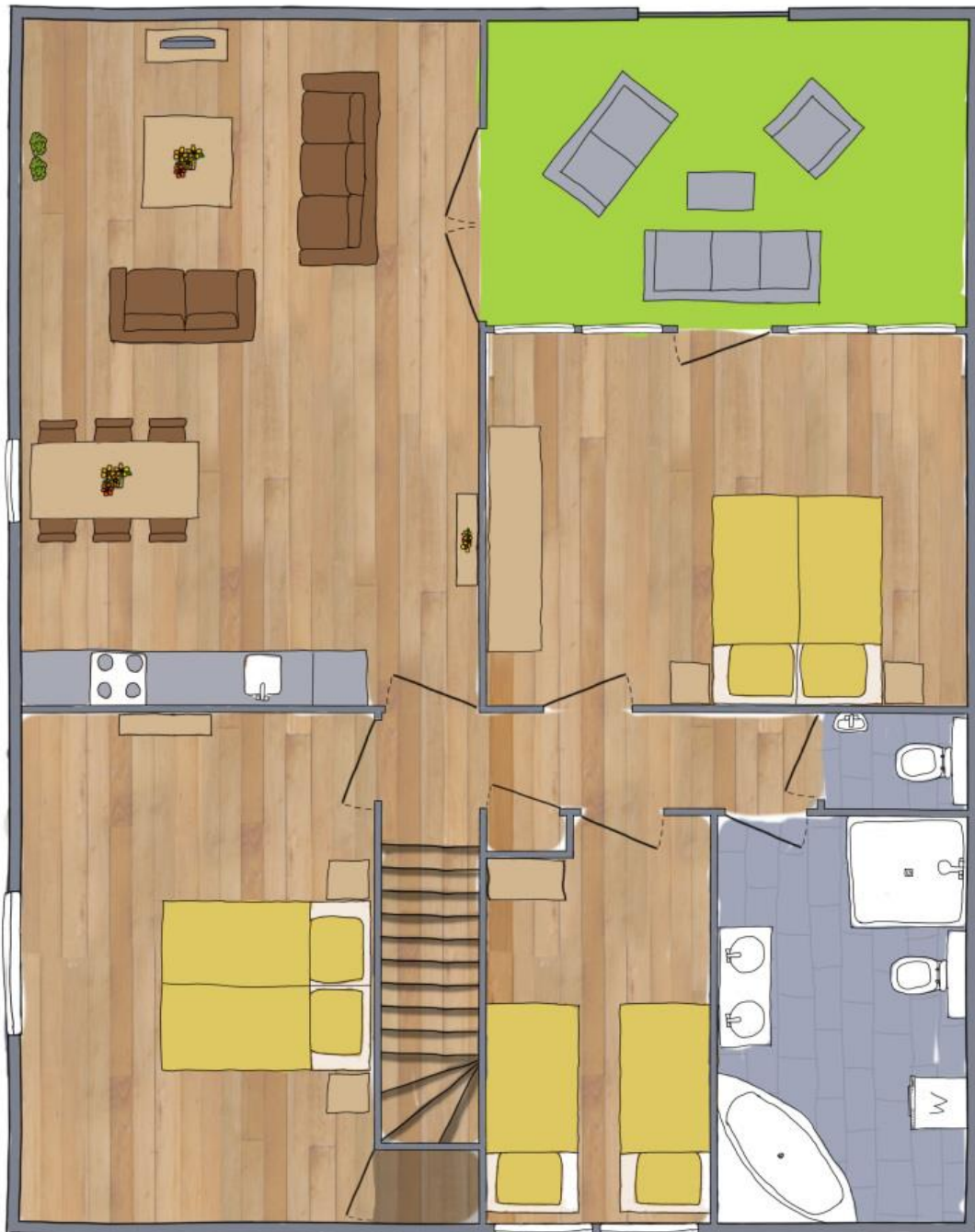
Hierboven : Plattegrond de Parel